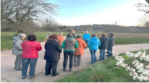
Frühschicht und Fastenspaziergang mit Abschluss an der Kapelle